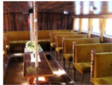
Takasalonki: 46 istumapaikkaa