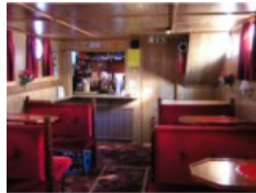
Etusalonki: 24 istumapaikkaa