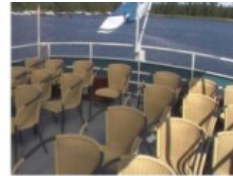
Takakansi: 50 istumapaikkaa